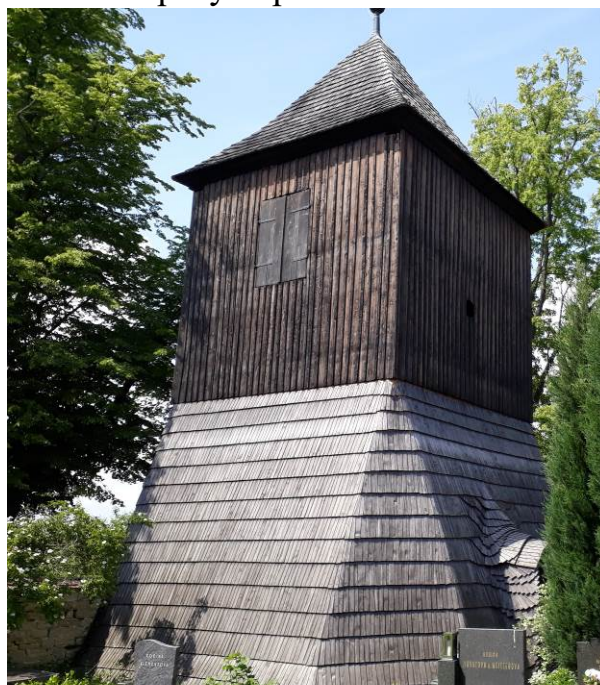
Dřevěná zvonice v obci Radhošť