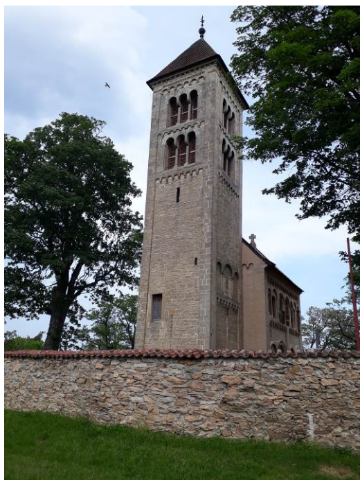
Kostel sv. Jakuba v obci Jakub

První inspirací pro dnes už tradiční poutní putování svatojakubské farnosti České Heřmanice byla před patnácti lety pouť do Compostely, kam po staletí proudí