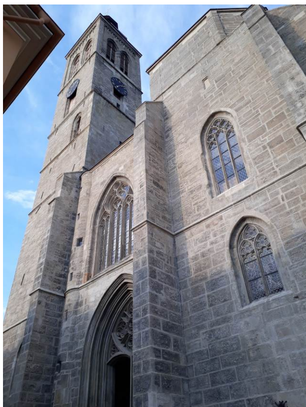
Kostel sv. Jakuba v Kutné Hoře

Na pouť jsme vyjeli ve středu odpoledne 23. 5. přes Vysoké Mýto do obce Radhošť, kde byla naplánována první zastávka. Nejrannější písemná zmínka o obci je ze stejného roku, jako naše – 1226. Také o kostelu se poprvé píše 1350 jako o tom našem. S milou, nadšenou patriotkou jsme měli možnost si jej prohlédnout i s vystoupaním ke zvonům v nádherné dřevěné zvonici. Až do Pardubic nám z obou stran hrozily bouřky, ale nakonec i večerní prohlídka krajského města se obešla bez deště.